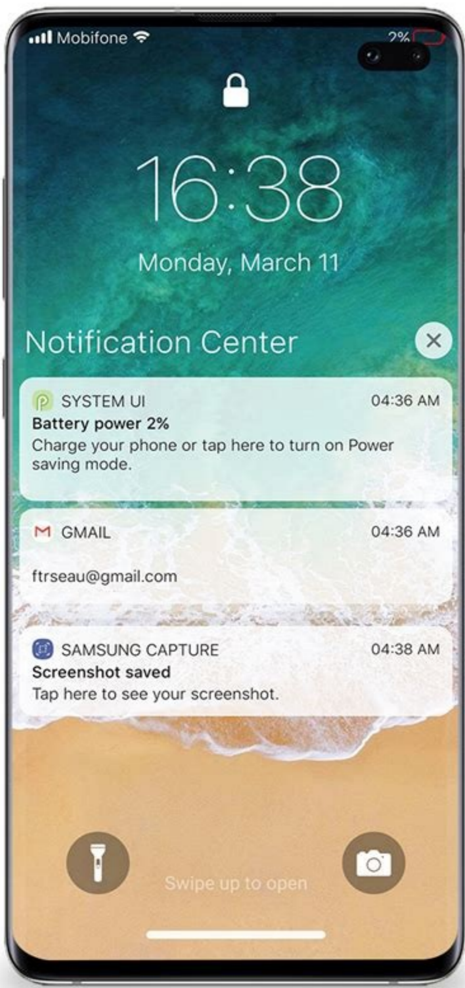
Galaxy S10 Plus