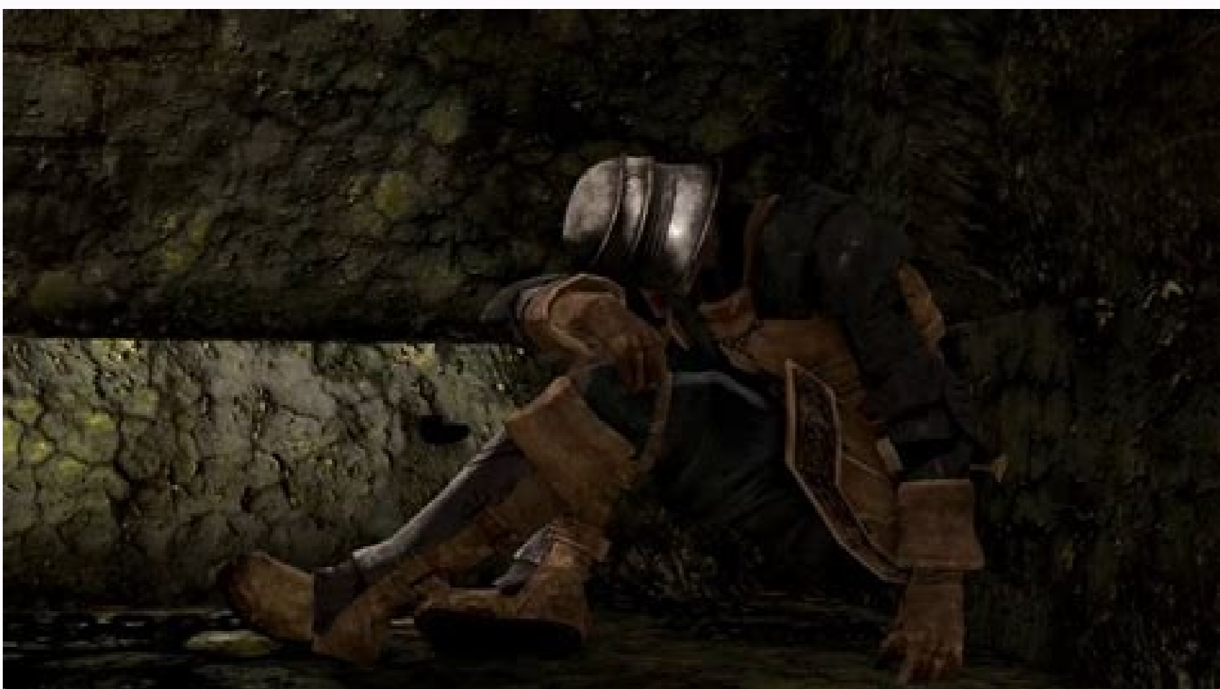
Dark souls remastered 100 trophy guide.