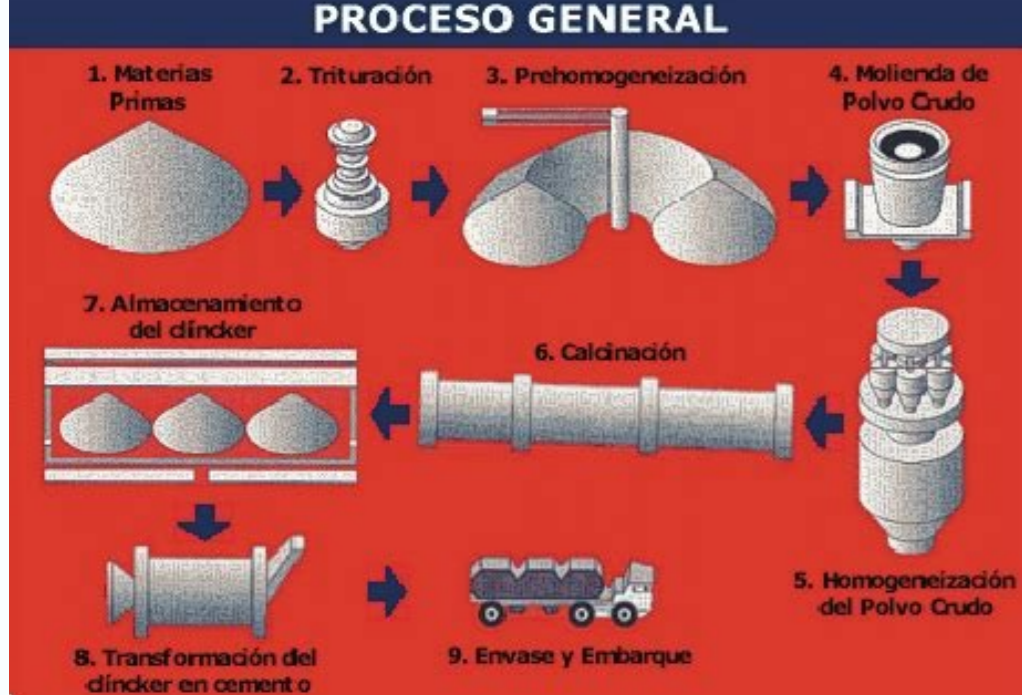
Etapas de fabricación del cemento portland. Diagrama de flujo fabricacion cemento portland. Proceso de fabricación del cemento portland. Como pintar cemento exterior. Proceso de fabricacion de cemento portland.